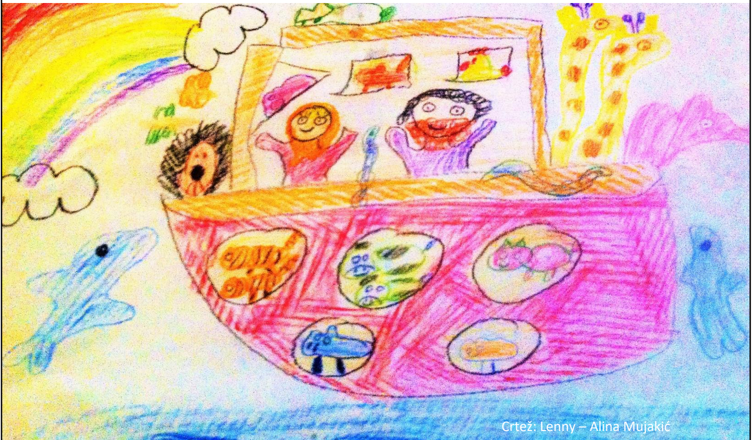
Crtež: Lenny – Alina Mujakić